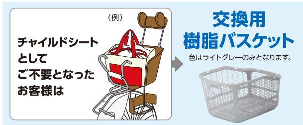
リコール対象商品 12モデル(色は一例です)