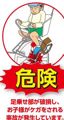
リコール対象商品(12モデル)の一例